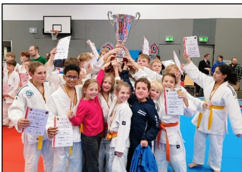
Bild: Pokal der Bezirke U11 und U13

Unsere Athletinnen und Athleten nahmen im vergangenen Jahr in allen Altersgruppen, von der U11 bis zu den Erwachsenen, regelmäßig und erfolgreich an Lehrgängen und Turnieren teil. Besonders hervorzuheben ist, dass unser Bezirk dank starker Leistungen unserer U11- und U13 Judoka den Pokal der Bezirke gewinnen konnte.