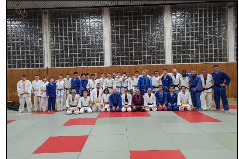
Bild: Bezirksrandori in Nieder-Olm

Zusätzlich haben wir für die Altersklasse der U15 bis zu den Erwachsenen eine Bezirksrandori Einheit organisiert, zu welcher alle Vereine des Bezirks und der näheren Umgebung eingeladen waren – der Austausch wurde durchweg positiv aufgenommen.